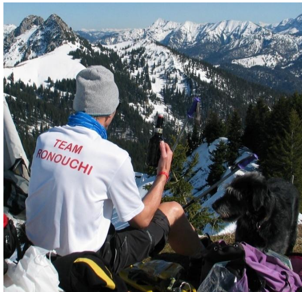
Team Ronouchi ... on top of the world

Völlig egal, ob Du schnell oder langsam bist, Hauptsache Du bist dabei.