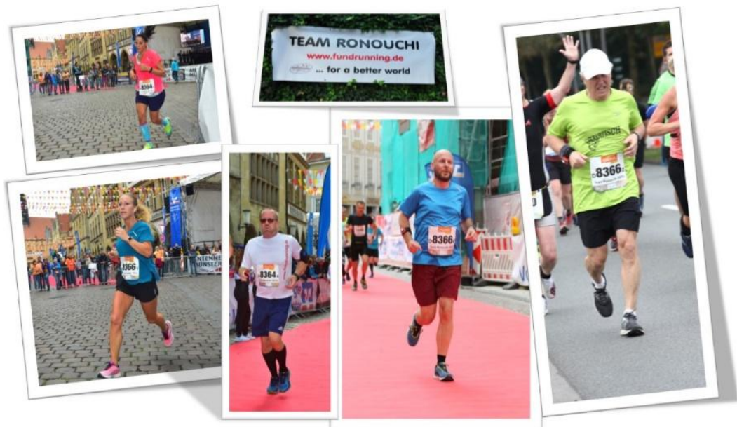
Staffelmaraathon Münster 2019

Wenn es im Training oder Wettkampf schlecht läuft, denke einfach an Menschen, bei denen es im Leben richtig schlecht läuft.