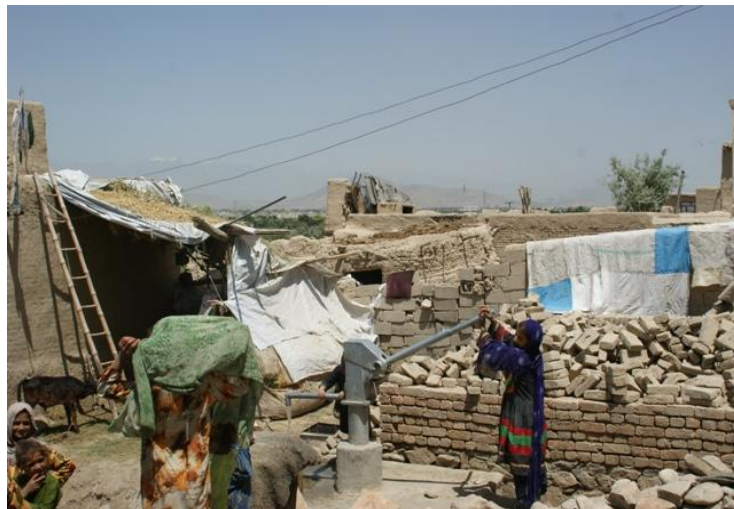
Brunnen im Töpferdorf Shina in Afghanistan