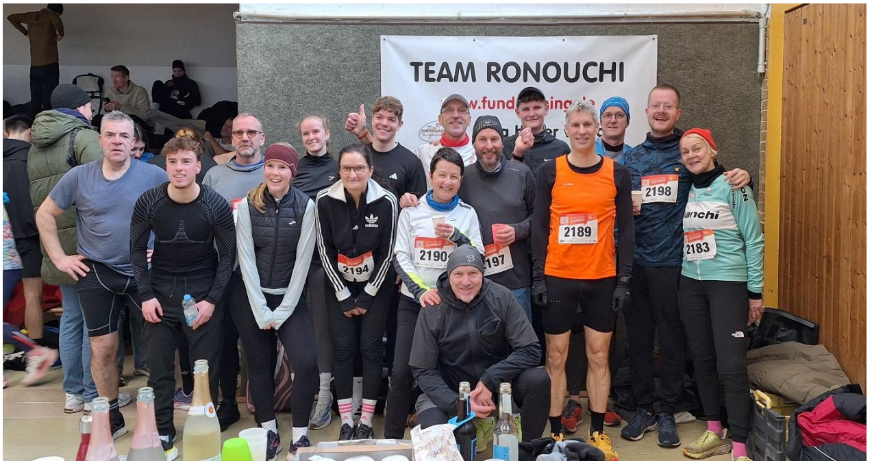
Silvesterlauf Münster 31.12.2025

Refine Your Sport! Veredle Deinen Sport! Mit Team Ronouchi und Fundrunning for a better world